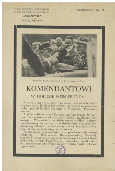
Druk Komendantowi w hołdzie pośmiertnym , rozpoczynający się od słów: „Nie z roli, ani z soli, lecz z tego co boli wyrósł w Królewską moc i aby Królom był równy... powszechną wolą Narodu... pośród Królów spocznie w Krakowie (...).”