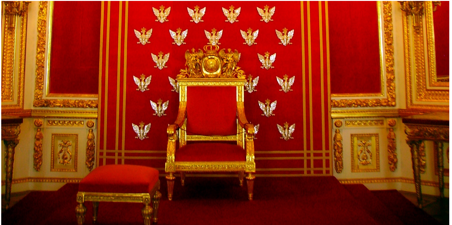
Tron Stanisława Augusta Poniatowskiego na Zamku Królewskim w Warszawie.

https://przystanekhistoria.pl/pa2/tematy/niepodleglosc/61194,Monarchisci-II-RP.html