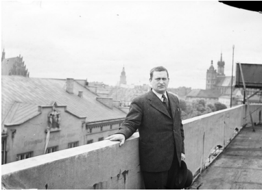
Stanisław Cat-Mackiewicz - redaktor naczelny wileńskiego „Słowa” w latach 20. XX w. Na fotografii z maja 1939 stoi na dachu Pałacu Prasy w Krakowie.