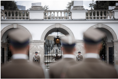
Wojna polsko-czechosłowacka w dniach 23-30 stycznia 1919 roku i bitwa pod Skoczowem zostały upamiętnione na jednej z tablic Grobu Nieznanego Żołnierza w Warszawie.