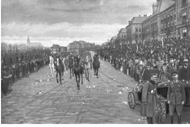
Wkroczenie wojsk polskich do Cieszyna po rozejmie z Czechami w lutym 1919 r.