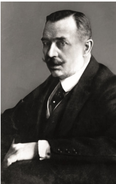
Maurycy Klemens Zamoyski. Fot.

Za pośrednictwem Towarzystwa Dobroczynności i Towarzystwa Opieki nad Chorymi (był wiceprezesem obydwu) pomagał chorym i cierpiącym. Pełnił też ważne funkcje w stowarzyszeniach zajmujących się różnymi dyscyplinami sportu. Zasiadał w niezliczonej ilości komitetów. Można powiedzieć, że brał udział w niemal każdej poważnej inwestycji w ówczesnej Warszawie. Szacuje się, że roczne wydatki Zamoyskiego na cele społeczne sięgały do 5 proc. dochodów ordynacji. O jego pozycji świadczyć może to, że proponowano mu wejście do Rady Regencyjnej Królestwa Polskiego.