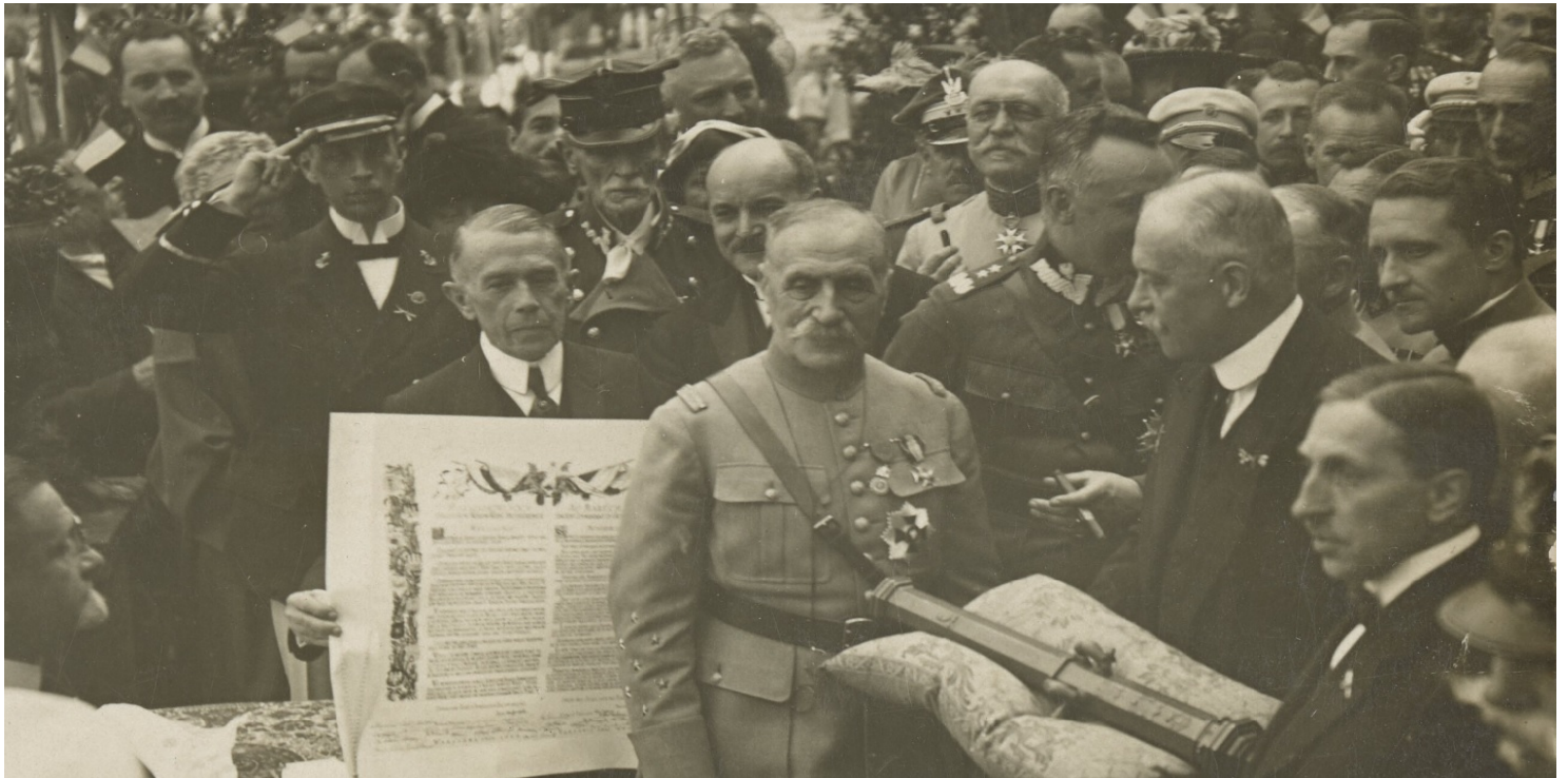
Ferdynand Foch w Warszawie, 1923 r.

https://przystanekhistoria.pl/pa2/tematy/niepodleglosc/76069,Wrog-Niemiec-przyjaciel-Polakow.html