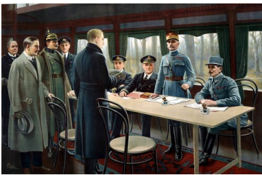
Podpisanie rozejmu w Compiègne w 1918 r. (marsz. Ferdinand Foch drugi z prawej).

Taktyka ta powodowała jednak znaczne straty, stąd w kolejnym okresie Wielkiej Wojny Foch został odsunięty od dowodzenia.