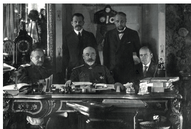
Dowództwo Sił Zbrojnych Południa Rosji; w środku gen. Anton Denikin, 1919 r.