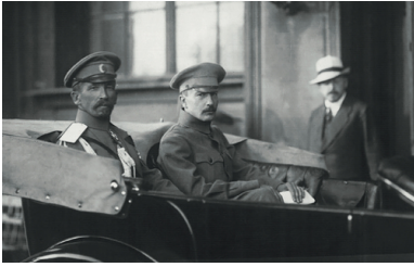
Generał Ławr Kornilow i Borys Sawinkow, 1917 r.