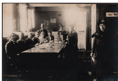
Jeden z katowickich, plebiscytowych lokali wyborczych.