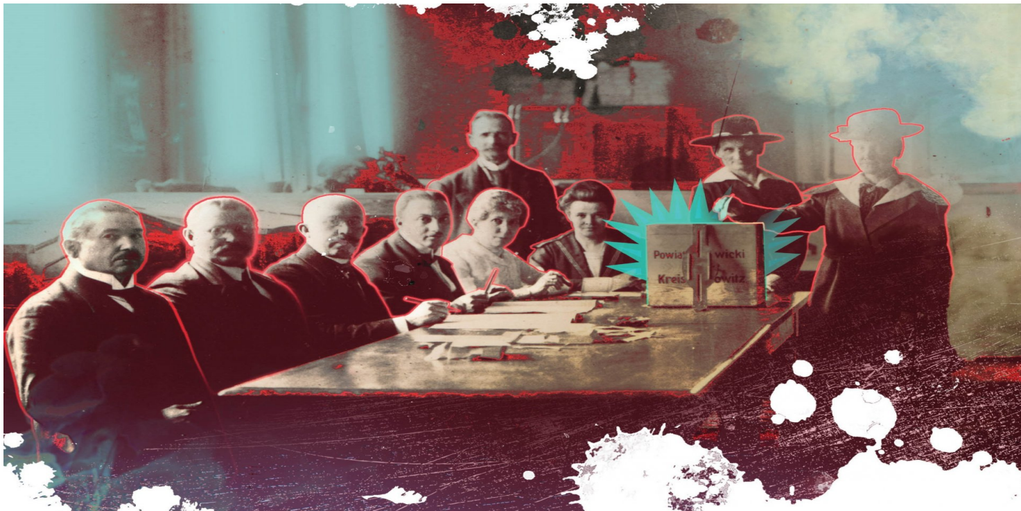
Jeden z katowickich, plebiscytowych lokali wyborczych.

https://przystanekhistoria.pl/pa2/tematy/niepodleglosc/79952,Powstania-slaskie-i-plebiscyt-w-objektywie-Rysowanie-za-pomoca-swiatla-a-sprawa-.html