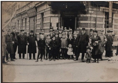
Grupa głosujących przed jednym z lokali wyborczych w Katowicach