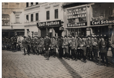
Francuscy strzelcy alpejscy na katowickim rynku, lata 1920-1921

Kwestia własności cennego, górnośląskiego przemysłu nie była jednak ważna tylko dla tych dwóch rywalizujących ze sobą państw; była też potencjalnie istotnym elementem wpływającym na układ sił w powojennej Europie. Z drugiej strony, zdaniem części zagranicznych obserwatorów, konflikt ten mógł doprowadzić do wznowienia zakończonych w 1918 r. działań wojennych w skali europejskiej. Nie powinno zatem dziwić, że lata 1919-1921 to okres największego w historii zainteresowania Górnym Śląskiem wykazywanego przez prasę zagraniczną, nie tylko europejską. Efektem nadzwyczajnego zaciekawienia burzliwą sytuacją w regionie są też liczne, wykonane w tamtym okresie zdjęcia, czemu sprzyjał zaawansowany już wówczas poziom rozwoju techniki fotograficznej oraz jej powszechność. Także pod tym względem czasy powstania i plebiscytu były na Górnym Śląsku wyjątkowe – prawdopodobnie to jeden z najbardziej „obfotografowanych” okresów w historii tego regionu (przynajmniej do 1945 r.).