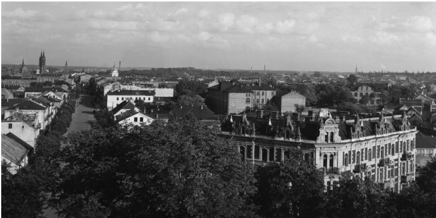
Widok ogólny Białegostoku w okresie międzywojennym.

https://przystanekhistoria.pl/pa2/tematy/niepodleglosc/81689,Misja-sedziego-Straszewicza.html