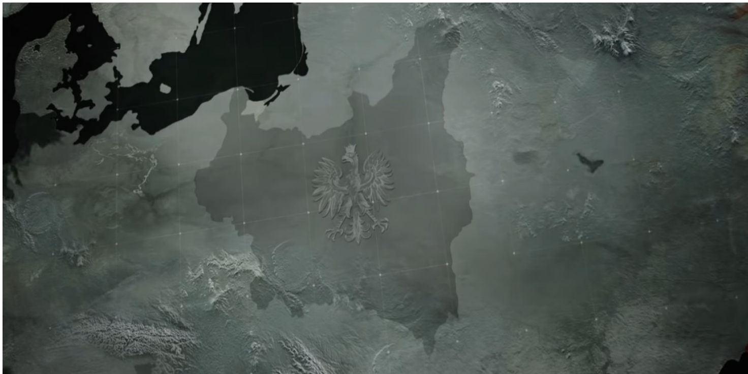
Kadr z filmu IPN "Niewycięzeni"

https://przystanekhistoria.pl/pa2/tematy/niepodleglosc/81940,Deklaracja-wersalska-z-3-czerwca-1918-roku-za-pomniani-akt-zalozycielski-II-RP.html