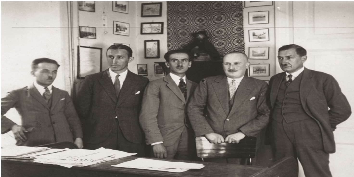
Redakcja wileńskiej gazety „Słowo”.

https://przystanekhistoria.pl/pa2/tematy/niepodleglosc/87128,Jozef-Mackiewicz-na-progu-niepodleglosci.html