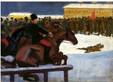
Demonstracja uliczna w 1905. Obraz Władysława Skoczylasa ze zbiorów Muzeum Narodowego w Warszawie

W czasie rewolucji 1905 r. do rozłamu doszło również w PPS. Działacze związani z Piłsudskim – tzw. starzy, dla których priorytetem była walka o niepodległą Polskę, utworzyli PPS-Frakcję Rewolucyjną. Natomiast zwolennicy współpracy z socjaldemokracją rosyjską, którzy przeciwstawiali się w ogóle istnieniu odrębnego państwa polskiego – tzw. młodzi, stworzyli PPS-Lewicę i odtąd ściśle współdziałali w zwalczaniu idei niepodległościowej z inną skrajną partią lewicową – Socjaldemokracją Królestwa Polskiego i Litwy. Po rozłamie w PPS Piłsudski i jego zwolennicy przenieśli swoją działalność do zaboru austriackiego. W następnych latach stali się głównymi rzecznikami stworzenia siły zbrojnej, która w odpowiednim momencie miała przystąpić do walki z Rosją o niepodległość Polski.