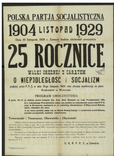
Afisz dot. obchodu 25. rocznicy manifestacji na placu Grzybowskim w Warszawie z 1904 r., ze zbiorów Biblioteki Narodowej

Na rozwój świadomości narodowej we wszystkich zaborach wpłynęła jednak nie tylko działalność polityczna. Ważną rolę odegrała twórczość Henryka Sienkiewicza, piszącego „ku pokrzepieniu serc” o wielkości dawnej Rzeczypospolitej, którego chłopci witali słowami „Tyś nas zrobił Polakami”, malarstwo Jana Matejki, a w wypadku inteligencji – budzące dumę z przeszłości Polski prace historyczne Szymona Askenazego. Nieocenione zasługi w uświadomieniu narodowym chłopów mieli polski nauczyciel i ksiądz.