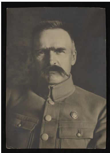
Józef Piłsudski.