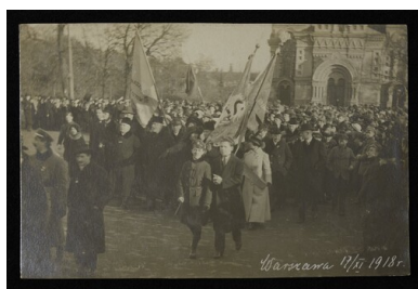
Manifestacja patriotyczna - wielki

10 listopada 1918 r. do Warszawy przybył Józef Piłsudski, przed którym klęska państw centralnych otworzyła bramy więzienne. Powrót komendanta I Brygady Legionów do kraju zbiegł się z zawieszeniem broni między Niemcami a ententą 11 listopada, które zakończyło I wojnę światową i równocześnie okazało się początkiem tworzenia polskiej państwowości. Jednak nie był to proces łatwy.