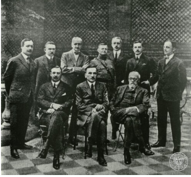
Kierownictwo Komitetu Narodowego Polskiego w Paryżu. Siedzą od lewej: Maurycy Zamoyski, Roman Dmowski, Erazm Piltz. Stoją od lewej: Stanisław Kozicki, Jan Emanuel Rozwadowski, Konstanty Skirmunt, mjr Franciszek Fronczak, Władysław Sobański, Marian Seyda, Józef Wielowieyski.

Celem Legionów była walka z Rosją o niepodległość Polski. Początkowo brygady walczyły oddzielnie: I Brygada w Królestwie Polskim i na Podhalu, II Brygada – w Karpatach i na Bukowinie, gdzie legionieści zastąpili bohaterską szarżą kawaleryjską pod Rarańczę. W walkach na Lubelszczyźnie od lipca 1915 r. uczestniczyła III Brygada, przechodząc chrzest bojowy w bitwie pod Jastkowem. Jesienią 1915 r. Legiony Polskie skoncentrowano na froncie wołyńskim. Do końca września 1916 r. uczestniczyły tam w zaciętych bojach z Rosjanami, m.in. pod Kostiuchnówką, a następnie zostały wycofane do Królestwa Polskiego.