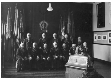
Grupa weteranów 1863 r. podczas otwarcia wystawy

Bili się o niepodległość w Legionach Polskich gen. Jana Henryka Dąbrowskiego, powstałych we Włoszech przy poparciu Francji, a później w czasie wojen napoleońskich. W powstałym w 1815 r. Królestwie Polskim dążyli do zachowania jego autonomii i występowali przeciw łamaniu konstytucji przez carów. Walczyli z Rosją w powstaniu listopadowym i tworzyli Wielką Emigrację. We wszystkich trzech zaborach prowadzili działalność spiskową zmierzającą do wywołania walki powstańczej, która często kończyła się zesłaniem konspiratorów na Syberię bądź uwięzieniem w pruskiej lub austriackiej twierdzy.