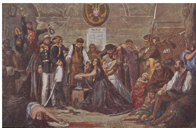
Obraz Jana Matejki Polonia 1863 ( Zakuwana Polska ) w reprodukcji na pocztówce z 1921 r., ze zbiorów Biblioteki Narodowej