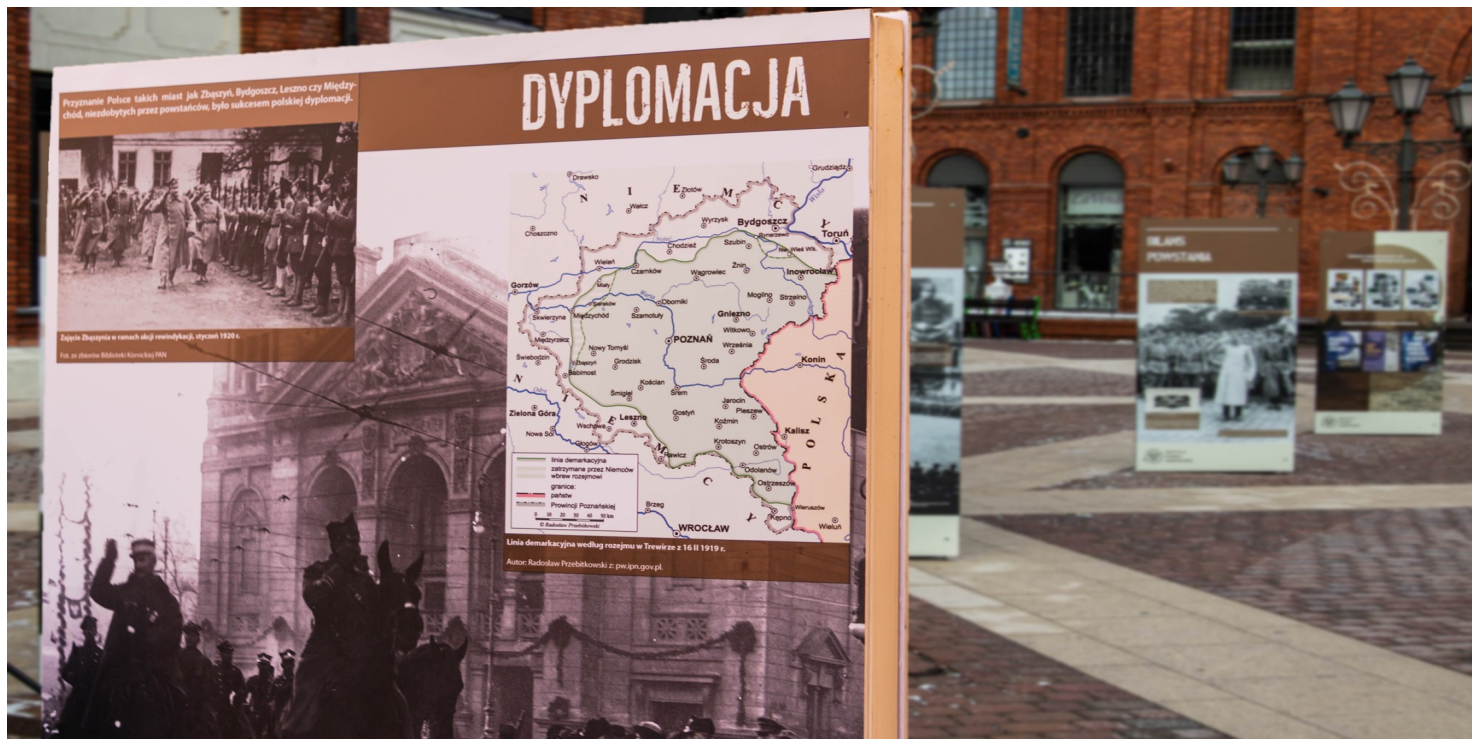
Wystawa IPN „Powstanie Wielkopolskie 1918-1919”

https://przystanekhistoria.pl/pa2/tematy/niepodleglosc/98871,Rozejm-w-Trewirze-Wielkie-zwyciestwo-sprawy-polskiej.html