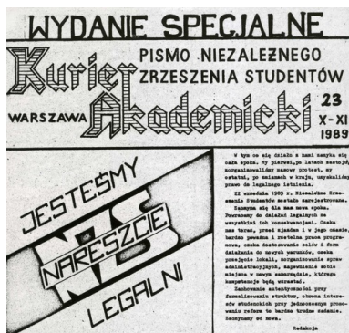
Pierwsza strona „Kuriera Akademickiego” informującego o rejestracji NZS, październik - listopad 1989 r.

Mimo sprzeciwu ze strony radykalnych działaczy, którzy wykluczali negocjacje z komunistami jako niemoralny kompromis, władze NZS zdecydowały się na przystąpienie do rozmów okrągłego stołu. „Solidarność” wyszła z negocjacji zwycięsko, wywalczyła prawo do funkcjonowania związku oraz częściowo wolne wybory. Nie da się tego powiedzieć o NZS, którego główny postulat – ponownej legalizacji – pozostał niespełniony. Tylko Jerzy Urban cynicznie zauważył, że komuniści powinni przystać na żądania NZS: