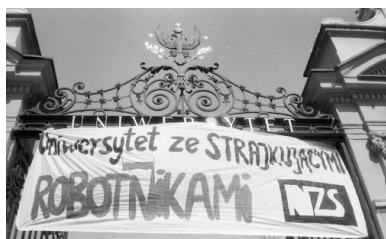
Transparent NZS-u na Uniwersytecie Warszawskim.