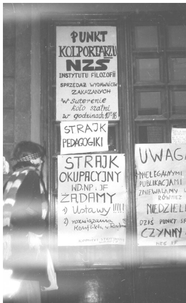
Strajk okupacyjny na Uniwersytecie Warszawskim, 11 grudnia 1981 r.

5 stycznia 1982 r. Niezależne Zrzeszenie Studentów zostało rozwiązane przez ministra nauki, szkolnictwa wyższego i techniki. Jak tłumaczyło ministerstwo, NZS systematycznie miało naruszać Konstytucję PRL i inne przepisy prawne poprzez prowadzenie działalności wymierzonej w zasady ustrojowe kraju, sojusze, szkalowanie władzy, nawiązywanie kontaktów zagranicznych z „wrogimi Polsce Ludowej ośrodkami i organizacjami”, drukowanie i kolportowanie nielegalnych wydawnictw, broszur i czasopism o treści antysocjalistycznej i antysowieckiej, podważanie zasad szkolenia wojskowego oraz współdziałanie z nielegalnymi organizacjami, w tym z Konfederacją Polski Niepodległej.