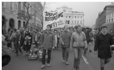
Pochód studencki w Warszawie w celu ponownej rejestracji NZS-u, 1 marca 1989 r.

W ciągu września i października 1980 r. NZS-y powstały na niemal wszystkich wyższych uczelniach w kraju. Statut nowej organizacji studenckiej, wspierany akcjami plakatowo-informacyjnymi w celu rejestracji, został w końcu zatwierdzony przez ministra Nauki, Szkolnictwa Wyższego i Techniki 17 lutego 1981 r.