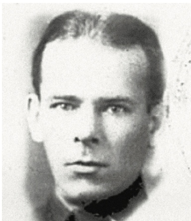
Generał Paweł Zielenin