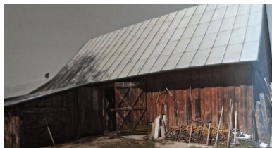
Krasnybór, stodoła małżeństwa Szyperów - miejsce przetrzymywania przez NKWD młodych mężczyzn zatrzymanych w Obławie Lipcowej. Selekcję prowadzili funkcjonariusze sowieccy, którzy na czas operacji zajęli dom PP. Szyperów.