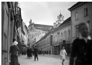
Polska, lata 30. XX w. Wilno, ulica Zamkowa. W tle kościół pw. św. Jana. Widoczne między innymi szyldy kolektury loterii państwowej i galanterii "F. Frliczki".

Ponieważ Tomkiewicz pracowała w „Legalizacji”, łączniczki pełniły tam służbę pomocniczą. W chwili zawiązania się siatki prawie wszystkie były nieletnie. Zaczęto je przezywać „kozami”. Nazwa przyłgnęła tak mocno, że stała się nieformalnym kryptonimem komórki.