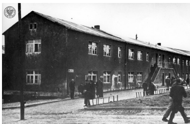
KL Buchenwald, blok 40., po wyzwoleniu, 1945 r.

Funkcje kapo w obozie oraz w zakładach zatrudniających więźniów przestali pełnić niemieccy kryminaliści, przejęli je komuniści, którzy w pewien sposób starali się „łagodzić reżim obozowy”. Pomimo to wśród więźniów