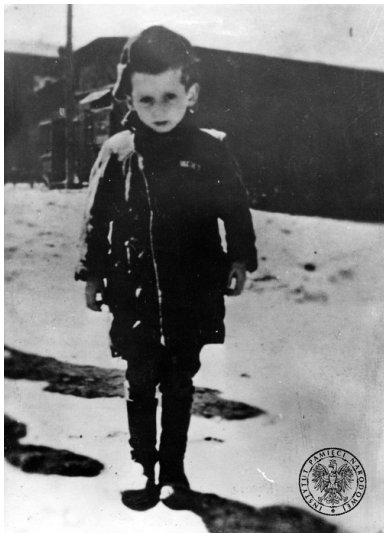
Dziecko - więzień KL Buchenwald