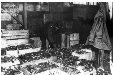
Magazyn łyżek na terenie KL Buchenwald