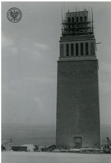
Wieża - pomnik ofiar faszyzmu w Buchenwaldzie (na Ettersberg k. Weimaru). Na odwrocie fotografii adnotacja o treści „Skrytka Złoto/Gold”