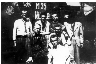
Grupa więźniów na tle rampy kolejowej. KL Buchenwald, b.d.