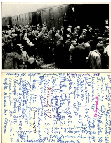
Fotokopia z fotografii przedstawiającej załadunek więźniów pierwszego transportu do KL Auschwitz - Tarnów, 14 czerwca 1940 r. Na odwrocie podpisy więźniów, zebrane po zakończeniu wojny.