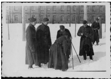
ajęcia z topografii wojskowej, 16 lutego 1938 r.