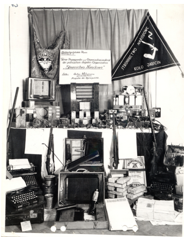
Sprzęt konspiracyjny przejęty przez niemiecką policję