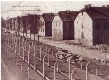
Bloki obozowe KL Auschwitz.

Pierwsza próba zrozumienia sytuacji przez Pileckiego: „Ach! Więc zamknęli nas w zakładzie dla obłąkanych!” przeradza się szybko w rzeczywistą ocenę stanu rzeczy. Każdego pytano po niemiecku, kim był w cywilu. „Odpowiedź: ksiądz, sędzia, adwokat powodowała bicie i śmierć. Przede mną w piątce stał jakiś kolega, który na to pytanie, rzucone mu z równoczesnym ujęciem go garścią za ubranie pod gardłem, odpowiedział: »Richter« [niem.: sędzia]. Fatalny pomysł! Po chwili był na ziemi bity i kopany”. Pilecki wreszcie zrozumiał: „Więc wykańczano specjalnie inteligencję. Po tym spostrzeżeniu zmieniłem nieco zdanie. To nie obłąkańcy, to jakieś potworne narzędzie do wymordowania Polaków, rozpoczynające swe dzieło od inteligencji”.