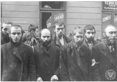
Jüdische Rabbiner [Z raportu Jürgena Stroopa o likwidacji niemieckiego getta dla Żydów w Warszawie.]

I uwzględniając ten kontekst sam rzetelnie posługuje się w książce wspomnieniami świadków.