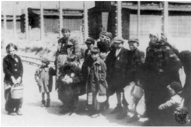
Zagłada Żydów węgierskich: w drodze do komór gazowych w niemieckim KL Auschwitz-Birkenau.

„Niniejsza praca również dąży do tego, by stać się „zintegrowaną historią”, ale skupia się, przede wszystkim, i bez apologizacji, na Żydach. Próbuje też podważyć tradycyjne koncepcje i periodyzację, które do tej pory stanowiły szkielet konstrukcji dziejów Holokaustu”.