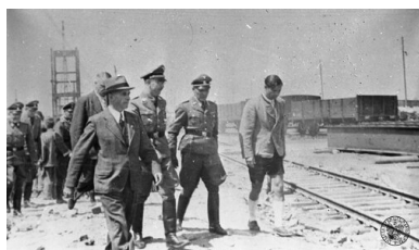
Szef SS Heinrich Himmler (3P) i

Höss uważał jednak, że metody Eickego są nie dość przemyślane, wnoszą chaos i nie dają pożądanego rezultatu: sprawnie funkcjonującej struktury lagrowej.