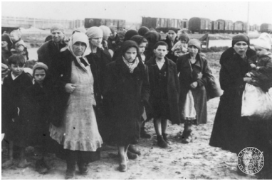
Grupa kobiet i dzieci przybyłych w transporcie do KL Auschwitz- Birkenau, sierowanych po selekcji do krematorium, maj 1944 r.

rozstrzelania, palenia żywcem, szczucia psami...), a także w konsekwencji wycieńczenia katorżniczą pracą, trudnymi warunkami panującymi w obozie i szerzącymi się tam chorobami. Później przede wszystkim w wyniku masowego mordowania gazem.