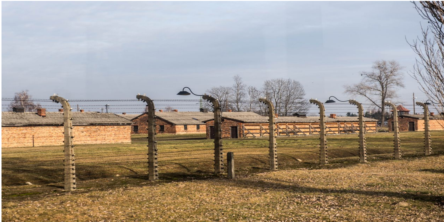
Teren byłego niemieckiego nazistowskiego obozu Auschwitz-Birkenau, 2020.

https://przystanekhistoria.pl/pa2/tematy/obozy-koncentracyjne/77980,Oswobodzenie-KL-Auschwitz-miedzy-pamiecia-a-propaganda.html