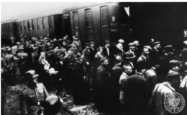
Formowanie pierwszego transportu do Auschwitz na dworcu kolejowym w Tarnowie, 14 VI 1940 r.

Czy jest to efekt polaryzacji narracji historycznych? W ostatnich latach bowiem, w publicystyce coraz częściej rozdziela się zbrodnie wobec Żydów, także polskich Żydów (w tym tych zasymilowanych, uznających się często za Polaków), od niemieckich zbrodni przeciwko Polakom. Dzieje się tak ze szkodą dla naszej historycznej świadomości. Wydaje się bowiem, że powinniśmy postrzegać Auschwitz jako miejsce wspólnej pamięci o męczeństwie Polaków i zagładzie Żydów.