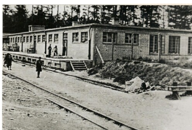
Niemiecki obóz pracy SS w Poniatowej. Hala nr 2, rampa kolejowa i magazyny.

22 października 1943 r. SS-Obergruppenführer Oswald Pohl podjął na piśmie decyzję o przejęciu obozu pracy SS w Poniatowej do Grupy Urzędów D – Obozy Koncentracyjne Głównego Urzędu Gospodarki i Administracji SS ( SS-Wirtschafts- und Verwaltungshauptamt (SS-WVHA) Amtsgruppe D – Konzentrationslager ). Tego samego dnia wydał również rozkaz, aby rozpoczęto prace zmierzające do jego przekwalifikowania na obóz koncentracyjny.