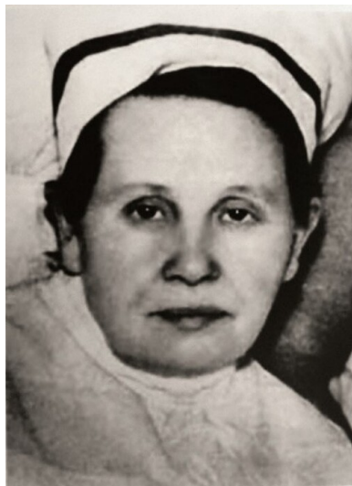
Stanisława Leszczyńska.

właściwe lekarstwo, natychmiast wysyłał wyleczone dzieci do komory gazowej.