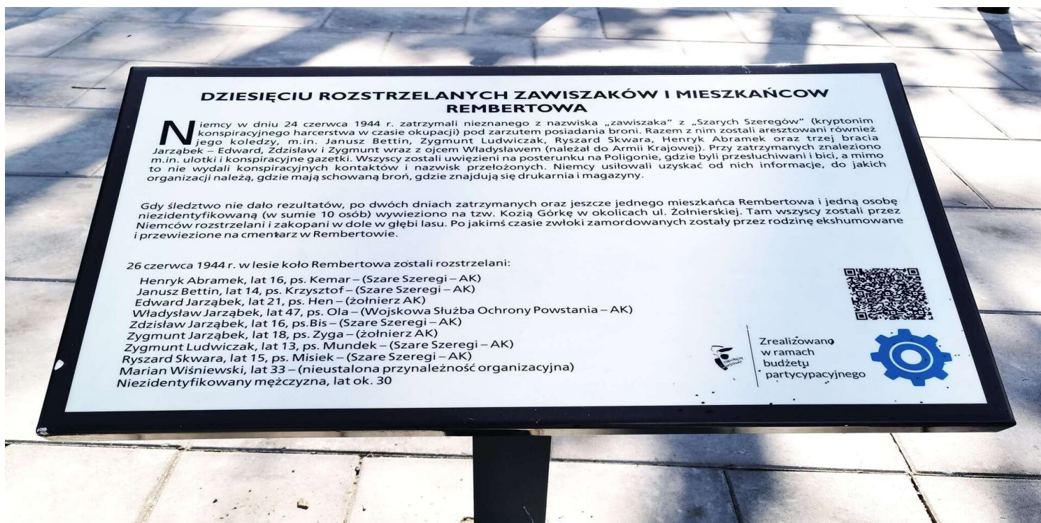
Tablica pamięci znajdująca się przy ul. Zesłańców Polskich u wylotu ul. Magenta w Warszawie-Rembertowie dot. dziesięciu rozstrzelanych mieszkańców Rembertowa

https://przystanekhistoria.pl/pa2/tematy/okupacja-niemiecka/101781,Mord-w-Rembertowie.html