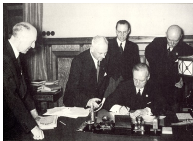
Podpisanie przez ministra spraw zagranicznych III Rzeszy Joachima von Ribbentropa niemiecko-sowieckiego paktu o nieagresji (tzw. Paktu Ribbentrop-Mołotow) w Moskwie, 23/24 sierpnia 1939 r.

Odmienną metodę zastosowali Sowieci. Była ona i bardziej cyniczna, i groteskowa. O losie wydartych Polsce obszarów zdecydować miała „wola ludności”. Mieszkańcy, wedle nowej terminologii, Zachodniej Ukrainy i Zachodniej Białorusi wprawdzie mieli wybrać swych reprezentantów. „Wybory” do „zgrupowań ludowych”, których wynik był przesądzony jeszcze przed ogłoszeniem ich terminu, służyły raczej wyeliminowaniu w pierwszej kolejności tych wszystkich, co do których zachodziło najmniejsze choćby podejrzenie, iż gotowi są protestować czy podjąć chociażby bierny opór.