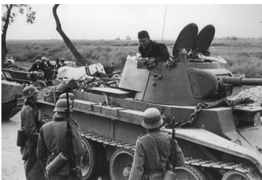
Sowiecki czołgista z pojazdu

Deportacja ludności z Kresów Wschodnich, przede wszystkim Polaków, osiągnęła o wiele większe rozmiary. Liczby i dziś jeszcze są trudne do ustalenia, opierają się na szacunkach. Nie wiadomo na przykład, jak wielka była pierwsza fala deportacyjna z jesieni 1939 r. W lutym wywieziono około ćwierć miliona osób, w kwietniu 1940 r. – ponad 300 tysięcy i zapewne tyleż samo w czerwcu 1940 r., po zajęciu republik nadbałtyckich. Ostatnia fala deportacyjna, z czerwca 1941 r., znów zapewne bliska była tej liczbie.