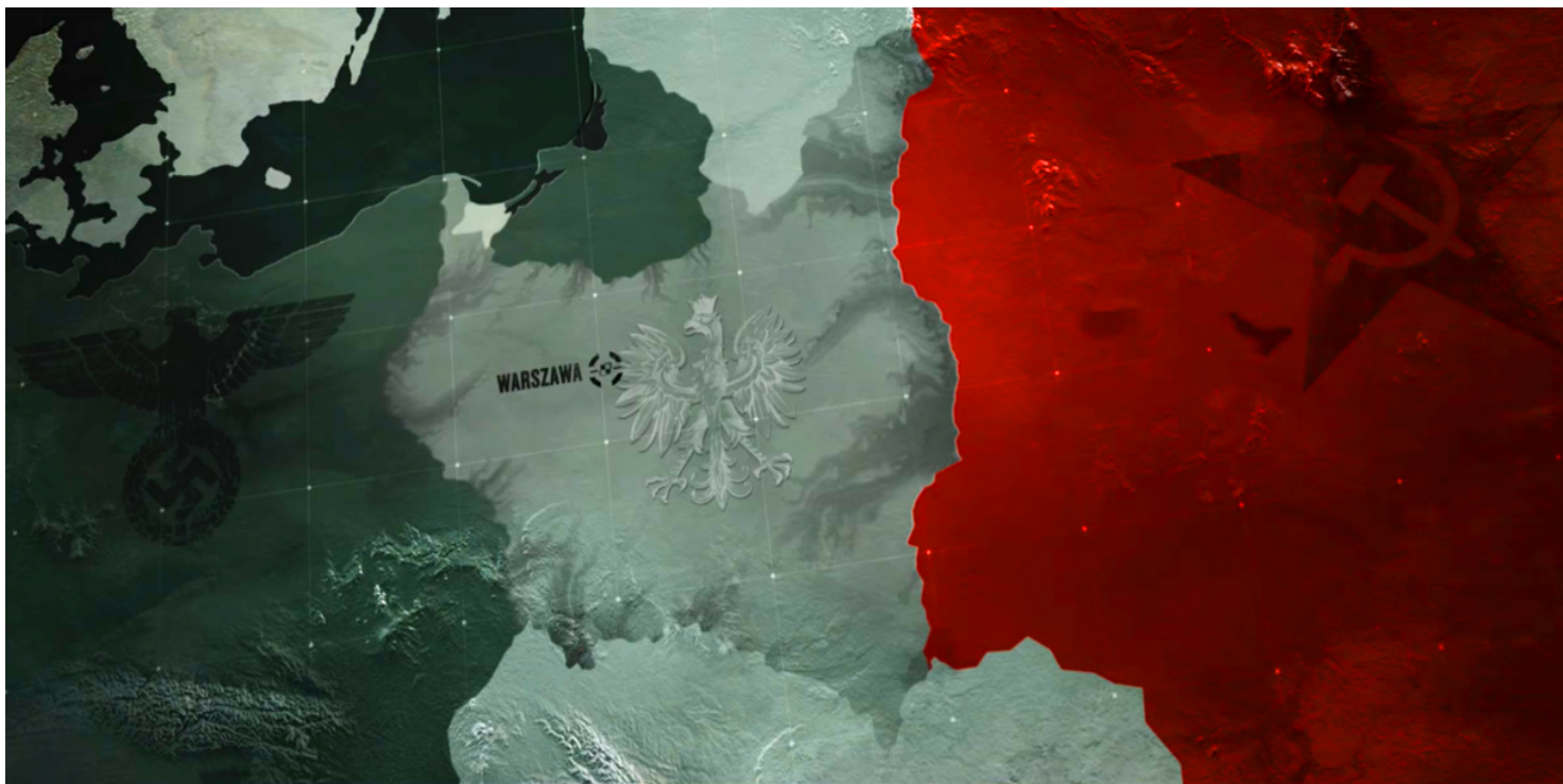
Kadr z filmu „Niezwyciężeni”

https://przystanekhistoria.pl/pa2/tematy/okupacja-niemiecka/103518,Dwie-okupacje.html