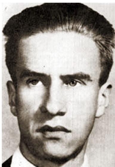
Stanisław Broniewski, zdjęcie wykonane pomiędzy 1943 a 1945 r.

Po ukończeniu studiów w 1938 r. wrócił do Warszawy, gdzie otworzył przewód doktorski. Od stycznia 1939 r. był zatrudniony w Biurze Ekonomicznym Prezesa Rady Ministrów. W związku z pracą naukową zawiesił działalność w harcerstwie, ale 27 sierpnia 1939 r. stanął się na alarmowej zbiórce Chorągwi Warszawskiej w parku Agrykola. Miesiąc później zostały powołane Szare Szeregi – konspiracyjna organizacja harcerska – pod komendą Floriana Marciniaka.