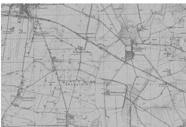
Siedlec i okolice na mapie z 1944 roku