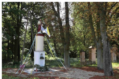
Kapliczka z figurą Jezusa w pobliżu pałacu w Siedlcu, współcześnie

Pamięć o losie dziewcząt z siedleckiego obozu jest bardzo istotna dla lokalnej społeczności, ale nie tylko dla niej. Wpisuje się ona w polską opowieść o II wojnie światowej, konflikcie, który odebrał dzieciństwo milionom najmłodszych obywateli Rzeczypospolitej.