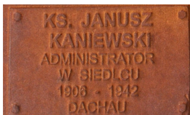
Tabliczka upamiętniająca księdza