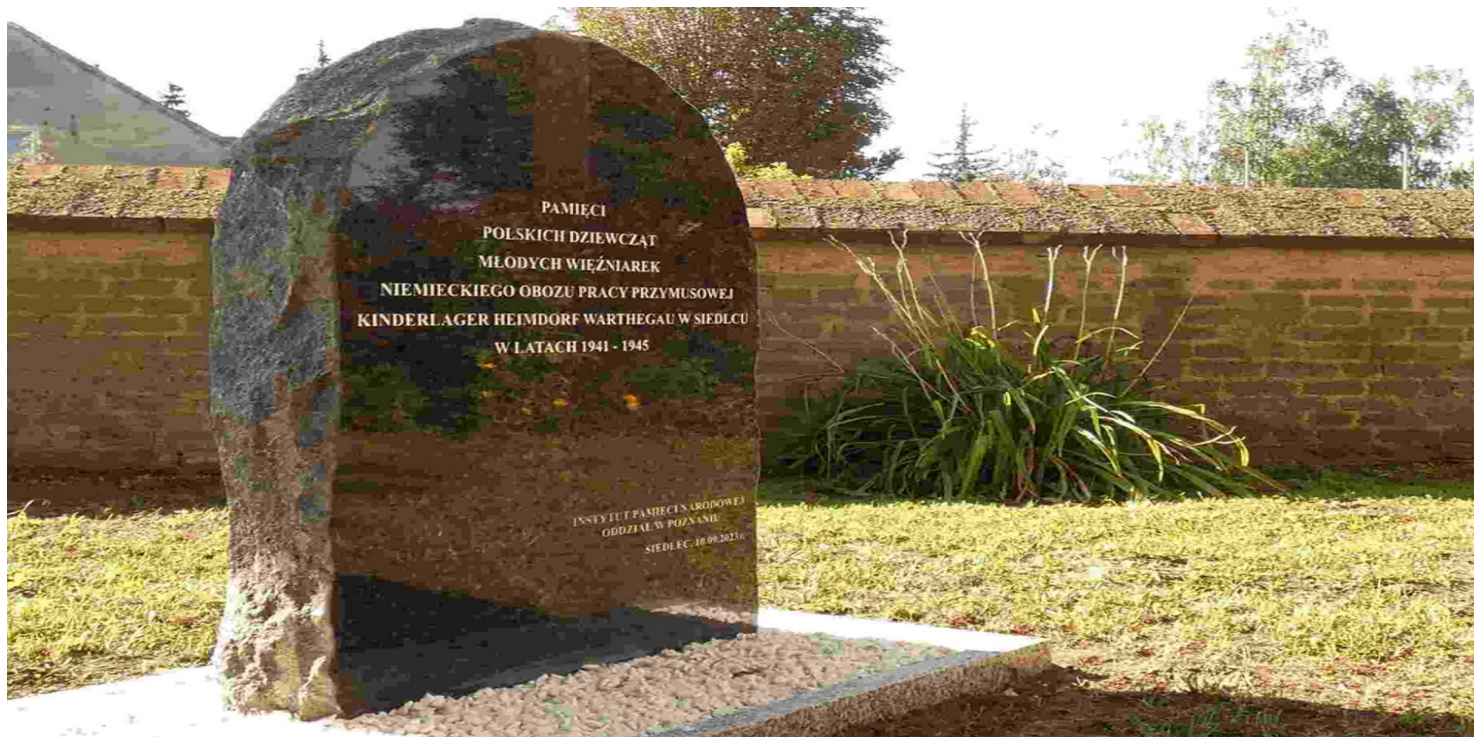
Pomnik poświęcony młodym więźniarkom

https://przystanekhistoria.pl/pa2/tematy/okupacja-niemiecka/105073,Wyrwane-z-rodzinnych-domow.html