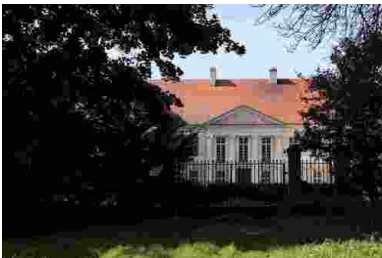
Pałac w Siedlcu współcześnie

Przymus pracy ( Arbeitszwang ) dotyczył także Polaków. Z samego Siedlca na roboty zabrano w czasie wojny około 30 osób. Przymus obejmował jednak nie tylko dorosłych, ale również dzieci powyżej 14 roku życia. W 1942 roku dolną granicę obniżono na rozkaz namiestnika Kraju Warty Arthura Greisera do 12 roku życia. W ten sposób nawet najmłodszy zostali włączeni w gospodarczą maszynę Rzeszy.