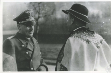
Wacław Krzeptowski wita Hansa Franka w Zakopanem