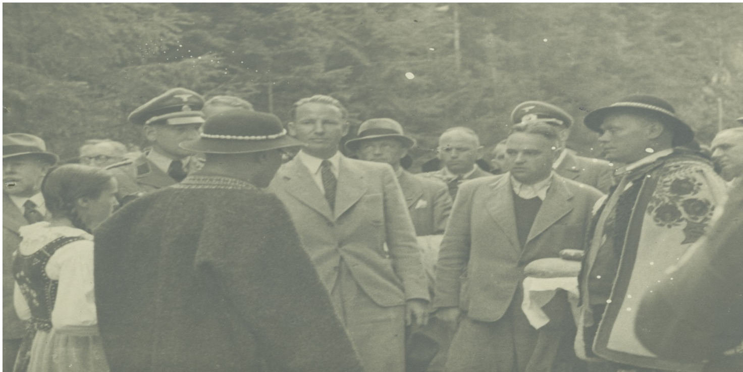
Wizyta gubernatora dystryktu krakowskiego Otto von Wächtera w Pieninach

https://przystanekhistoria.pl/pa2/tematy/okupacja-niemiecka/105541,Goralenvolk-Narzedzie-niemieckiej-polityki-wobec-Podhala.html