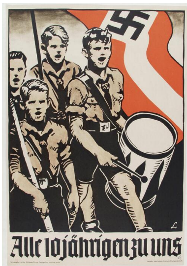
Nazistowski plakat propagandowy wzywający dzieci do członkostwa w Hitler-Jugend