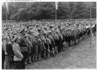
Uroczystość z udziałem Hitler-Jugend w Gliwicach (AIPN)