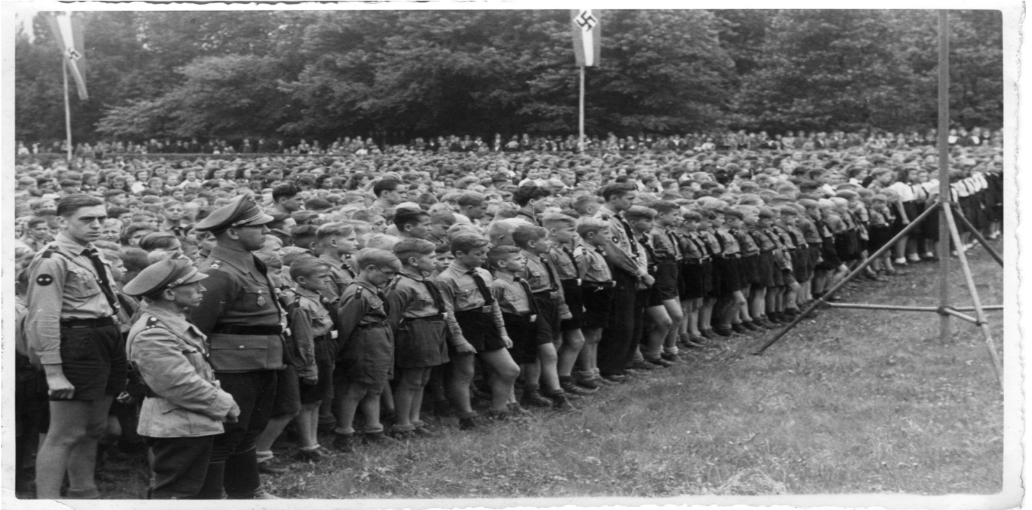
Uroczystość z udziałem Hitler-Jugend w Gliwicach (AIPN)

https://przystanekhistoria.pl/pa2/tematy/okupacja-niemiecka/29356,Hitler-Jugend-na-Gornym-Slasku.html