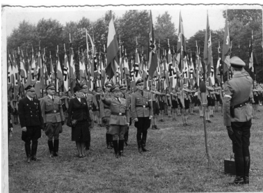
Uroczystość z udziałem Hitler-