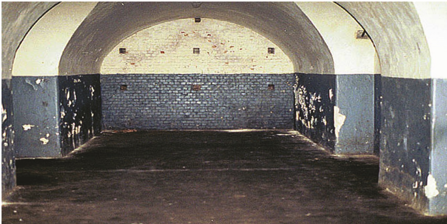
Cela w Fortcie VII, widok obecny.

https://przystanekhistoria.pl/pa2/tematy/okupacja-niemiecka/61359,Wieziennio-obozowe-wspomnienia-Wandy-Serwanskiej.html