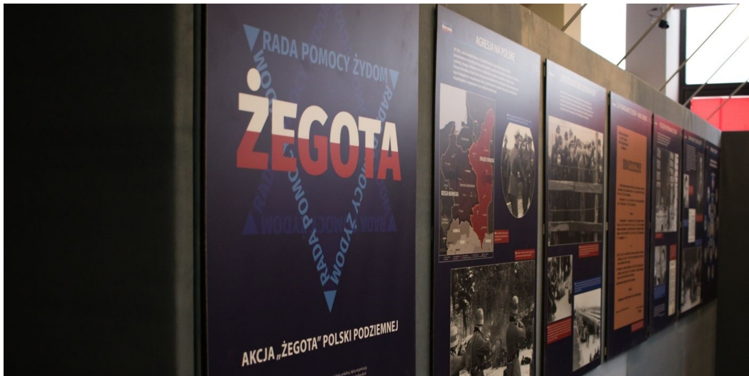
Wystawa „Akcja »Zegota« Polski Podziemnej”.

https://przystanekhistoria.pl/pa2/tematy/okupacja-niemiecka/64386,Wspolpraca-Rady-Pomocy-Zydom-i-Miedzyorganizacyjnego-Biura-Dokumentarnego.html