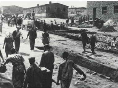
KL Płaszow bei Krakau - niemiecki nazistowski obóz pracy przymusowej w Płaszowie

Po czerwcowej deportacji Żydów zmniejszono obszar getta krakowskiego – 20 czerwca 1942 r. odcięto ulice Czarnieckiego, Rękawka, św. Benedykta, oraz południowe odcinki ul. Krakusa i Węgierskiej. Pozostali w dzielnicy mieszkańcy przystąpili do ponownego organizowania życia. Otwarte zostały te instytucje, z których wywieziono ludzi, jak np. szpitale czy ochronki dla dzieci. Nastąpił drugi okres adaptacji w żydowskiej dzielnicy mieszkaniowej.