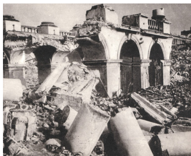
Pałac Saski w Warszawie, wysadzony przez Niemców w grudniu 1944 r.

ponad 60 tys. ludzi. Z kolei między majem a lipcem 1940 r. – 80 tys.; byli to głównie mieszkańcy centralnej i zachodniej Polski uciekający przed Niemcami. Ostatnia fala deportacyjna przypadła na czas między majem a czerwcem 1941 r. i dotknęła blisko 40 tys. osób. Ogółem wywózki objęły ponad 330 tys. obywateli II Rzeczypospolitej, przy czym liczba śmiertelnych ofiar podczas transportów wciąż nie jest znana. Szacunkowo ocenia się, że zginęło ok. 10 proc., głównie najbardziej narażonych, czyli najstarszych oraz dzieci.