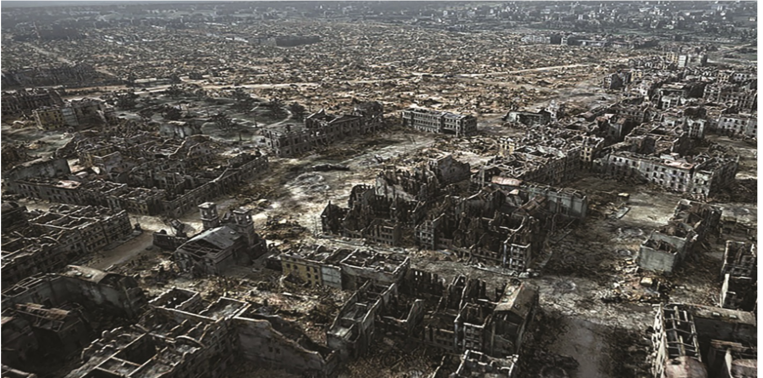
Warszawa w 1945 r. (rekonstrukcja). Kadr z filmu Miasto ruin produkcji Muzeum Powstania Warszawskiego

https://przystanekhistoria.pl/pa2/tematy/okupacja-niemiecka/67116,Niezakończone-rozrachunki.html