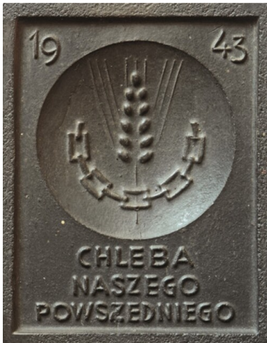
Cegielka Rady Głównej Opiekuńczej, 1943 r. Ze zbiorów Krystyny z Radziwiłłów Milewskiej. Reprodukacja: Piotr Życieński