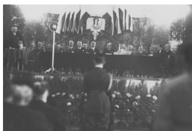
Zjazd gospodarczy Bezpartyjnego Bloku Współpracy z Rządem w Warszawie, 18 maja 1933 r. Prezydium zjazdu. Od lewej widoczni: wiceminister skarbu