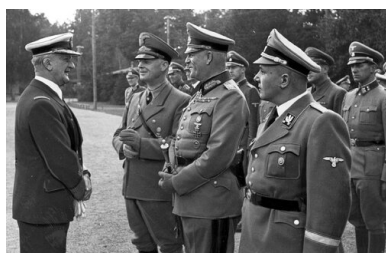
Od lewej: admirała Miklos Horthe, minister spraw zagranicznych Rzeszy Joachim von Ribbentrop, marszałek Wilhelm Keitel, Reichsleiter Martin Bormann.

Wartym odnotowania jest, że pozostali uwięzieni naziści wyrazili ulgę z powodu śmierci byłego współpracownika. Twierdzili bowiem, że Ley mógłby w trakcie procesu skompromitować nie tylko siebie, ale i całą strukturę niemieckiego reżimu.