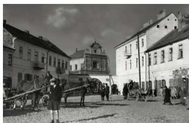
Getto radomskie

Żaden z mieszkańców dzielnic zamkniętych nie przypuszczał, że 1 sierpnia 1942 r. zacznie się unicestwienie radomskiej społeczności żydowskiej. Tego dnia do Radomia przybył Wilhelm Blum – podkomendny dowódca SS i policji w dystrykcie lubelskim, Odila Globocnika.