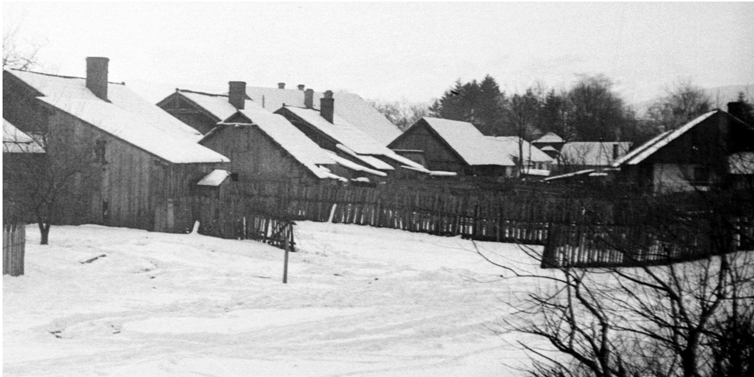
Wiejska zabudowa zimą - widok z lat 30.

https://przystanekhistoria.pl/pa2/tematy/okupacja-niemiecka/75722,Truczna-bagno-plugastwo-donos-na-nieboszczyka.html