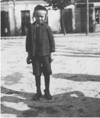
Dziecko żydowskie na ulicy Rudnika w okresie międzywojennym.

Zawyrokował więc, że „opowieść o dobrych chłopach i niewdzięcznych Żydach jest nazbyt czarno-biała, by mogła być przekonująca. Gorzej, jest nieprzekonująca i niemoralna”.