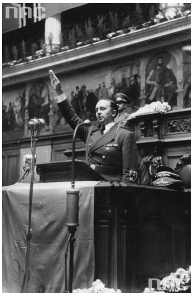
Harodove Arthivum Cyfrowe, sygn. 2-2701