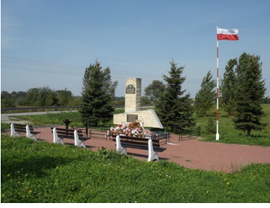
Pomnik upamiętniający poległych pod Słupią partyzantów