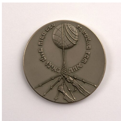
Medal Sprawiedliwy wśród Narodów Świata...