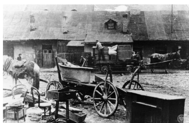
Żydowskie podwórko na