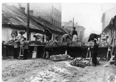
Budowa ceglanego muru w poprzek jednej z ulic na terenie Podgórze - tworzenie niemieckiego getta dla Żydów w Krakowie. Marzec 1941.

Były też obozy i wycieczki. Kiedyś całą klasą pojechali na Cmentarz Obrońców Lwowa. Tak kształtował się ich patriotyzm – przywiązanie do Rzeczypospolitej walecznej, a zarazem barwnej, wielonarodowej i wielowyznaniowej.