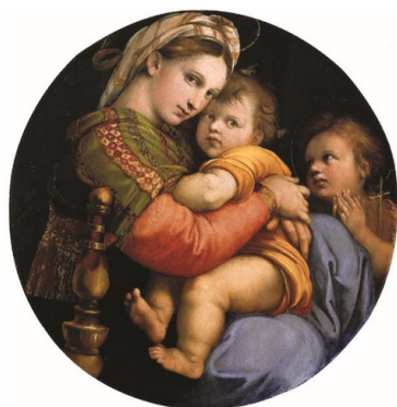
Madonna della Sedia - reprodukcja dzieła Rafaela

„Niemcy uprawiają dziki i prymitywny rabunek, co robi wrażenie «ewakuacji w pośpiechu». Rzuca się w oczy rażąca nieuczciwość Niemców. Powszechny jest widok wojskowych i urzędników dźwigających wielkie paczki towarów zabranych w sklepach polskich”.