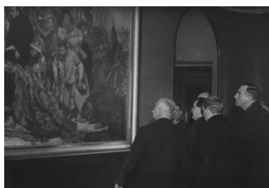
Hermann Goring w towarzystwie nierozpoznanych osób ogląda obraz "Batory pod Pskowem" w sali Batorego na Zamku Królewskim.