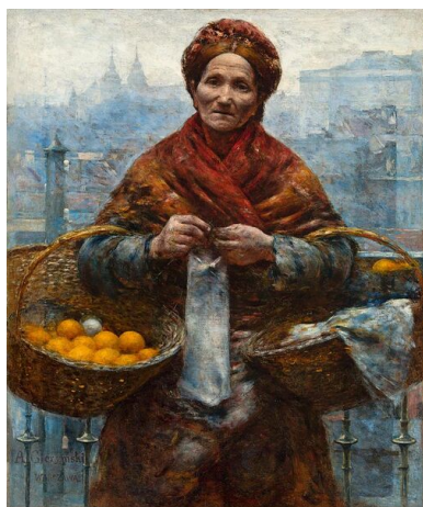
Obraz Żydówka z pomarańczami Aleksandra Gierymskiego przed II

Zagadnienie stopnia przygotowania poszczególnych instytucji i organów niemieckich do grabieży w Polsce wymaga jeszcze dodatkowych badań. Niektórzy zwracają uwagę na to, że to raczej posiadane kompetencje spowodowały, że naukowcy niemieccy zostali wciągnięci w proces grabieży na byłych ziemiach polskich. Jednak przedwojenne przyjazdy niemieckich uczonych do Polski – zwłaszcza w 1938 r. – mogły mieć już inny charakter niż czysto poznawczy. Zważywszy że w okresie poprzedzającym wybuch wojny resort nauki III Rzeszy zalecał niemieckim badaczom utrzymywanie jedynie sporadycznych kontaktów z polskimi uczonymi oraz instytucjami naukowymi. Zabezpieczały to drobiazgowo przepisy wewnętrzne, których przybywało zwłaszcza po 1937 r., gdy zaczęły się psuć stosunki polityczne między Polską a Niemcami. Mimo tych ograniczeń niektórzy niemieccy badacze dysponowali znacznymi środkami finansowymi, które umożliwiały im liczne podróże do Polski i tym samym zapoznanie się ze zbiorami dzieł sztuki.