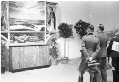
Hans Frank (w środku) w towarzystwie nierozpoznanych osób podczas zwiedzania galerii w Krakowie.

Trudno ustalić precyzyjną liczbę dóbr kultury zagrabionych przez administrację Generalnego Gubernatora. W przemówieniu wygłoszonym z okazji trzylecia GG 26 października 1942 r. Frank oświadczył, że na jego terytorium „zabezpieczono” około 90 proc. dzieł sztuki, oraz stwierdził, że są one własnością Generalnego Gubernatorstwa. Przez cały okres okupacji dobra kultury służyły jako wyposażenie wewnątrz urzędowych lub prywatnych siedzib dygnitarzy nazistowskich.