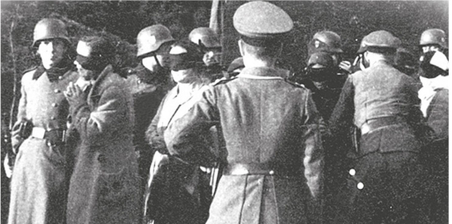
Egzekucja w Palmirach

https://przystanekhistoria.pl/pa2/tematy/okupacja-niemiecka/82829,Palmiry-symbol-niemieckiego-okrucienstwa.html