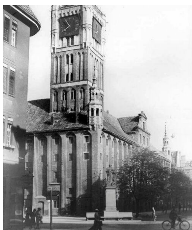
Ratusz Staromiejski w okresie