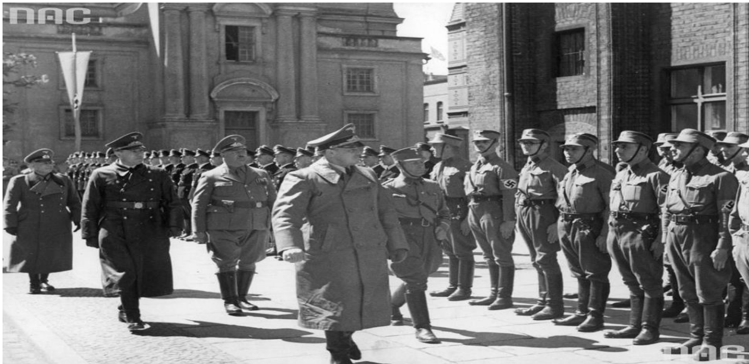
Narodowe Archiwum Cyfrowe, sygn. 2-3231 Generalny gubernator Hans Frank na toruńskim Rynku Staromiejskim w 1940 r. (fot. NAC)

https://przystanekhistoria.pl/pa2/tematy/okupacja-niemiecka/84313,Zycie-codzienne-pod-okupacja-niemiecka-w-Dzienniku-Eugeniusza-Przybyla.html