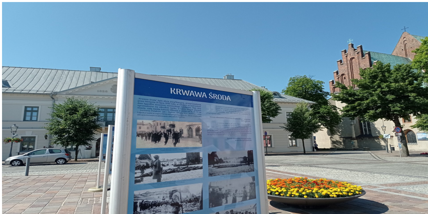
Wystawa na olkuskim Rynku

https://przystanekhistoria.pl/pa2/tematy/okupacja-niemiecka/85243,Krwawa-sroda-w-Olkuszu-31-lipca-1940-roku.html