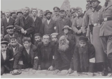
Grupa olkuskich Żydów zmuszona do pozowania z Niemcami na olkuskim rynku.