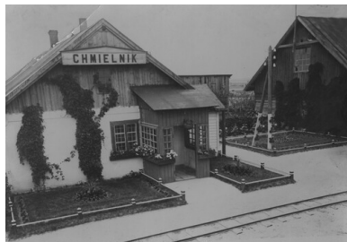
Stacja kolejowa w Chmielniku koło Kielc.