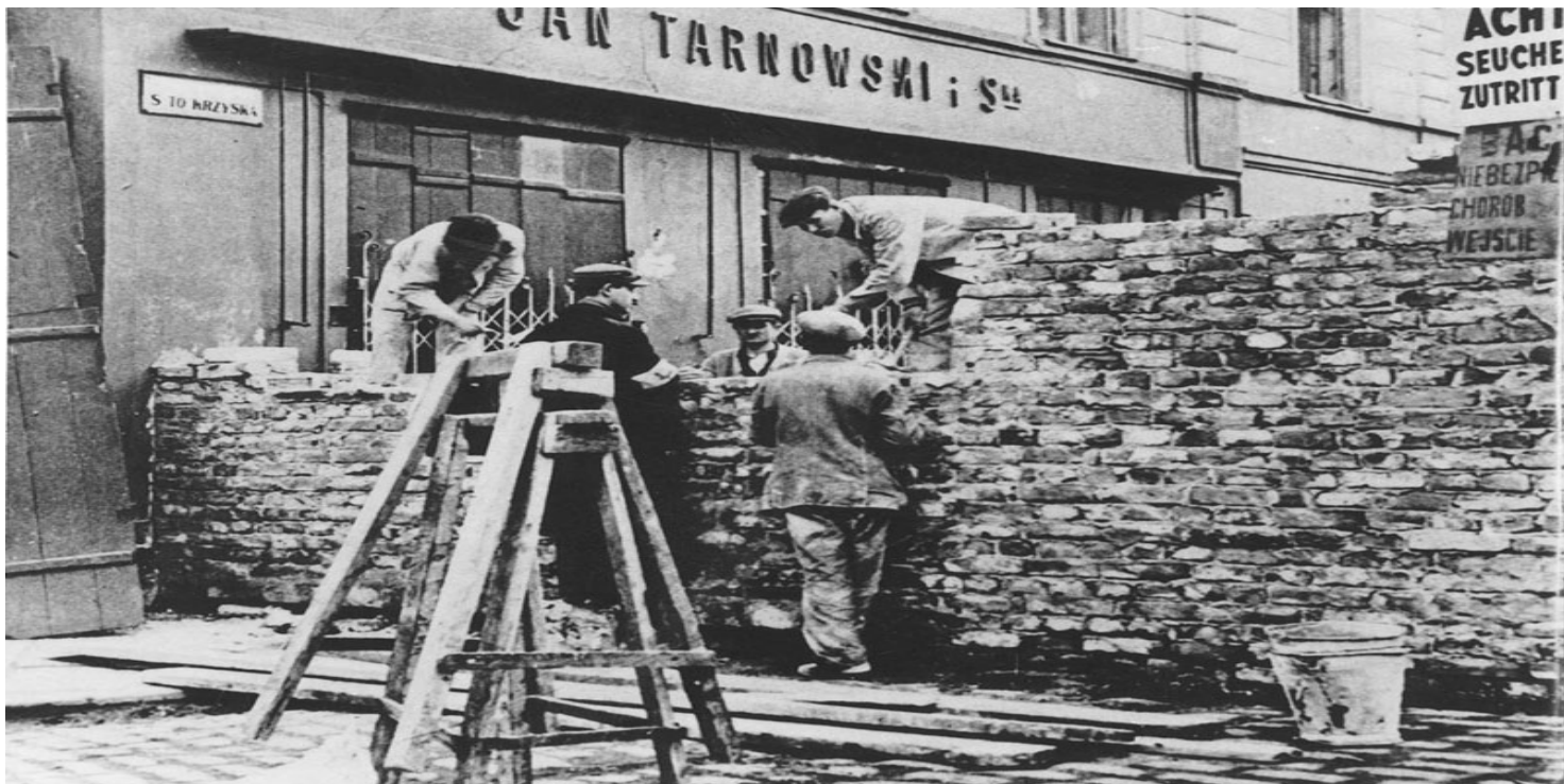
Budowa murów wokół dzielnicy żydowskiej w Warszawie, rok 1940

https://przystanekhistoria.pl/pa2/tematy/okupacja-niemiecka/86923,Smierc-za-dobro-Rozporzadzenie-Hansa-Franka-z-15-pazdziernika-1941-r-a-kwestia-r.html