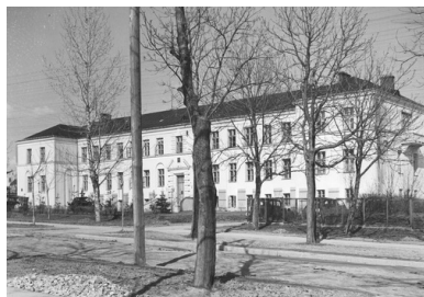
Budynek zajmowany w czasie okupacji przez niemiecką administrację Kreishauptmannschaft Busko, 1942 r.